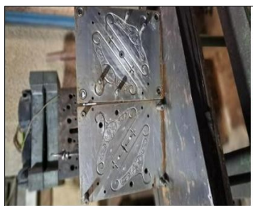
Molde gancho de ropa para bebe Precio $ 1100,00