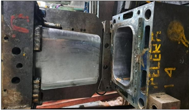
Molde papelera cuadrada