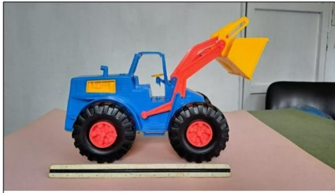
Juego de moldes para producir un tractor