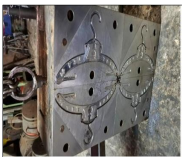
Molde gancho de ropa para niños Precio $1100,00

Los moldes de peine que se muestran a continuacion son a $1200,00 C/u