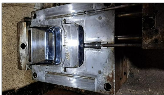
Molde Pala basura Grande Precio a consultar $ 1350,00