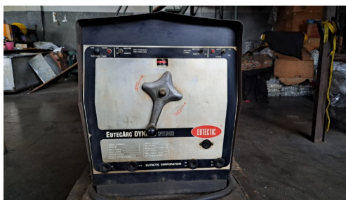
Soldador Tig Mic Eutectic

Venta de Moldes y Equipos. Contactar Eduardo Hung 0426 6054405