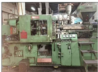
Maquina de inyeccion marca REED de 200 Tn de cierre y Tornillo con capacidad de 18 oz. Precio: $ 1700,00

Tambien hay una plastic-metal de 90 ton y un metalmeccanica de 60 ton. 100% operacionales.