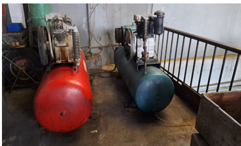
Azul compresor ABAC 15 hp Rojo compresor 5.5 hp