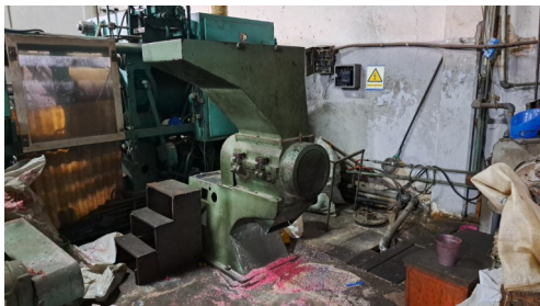
Molino marca Mateo y Sole Tipo B-10 de 10 Hp.