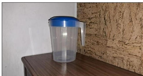
Jarra de 2 lts. Dos moldes