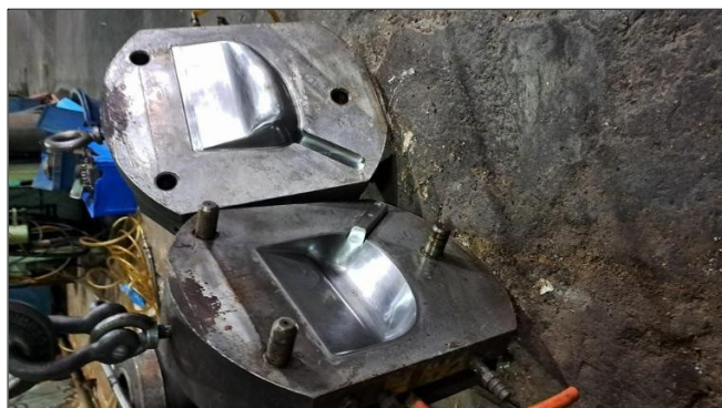
Molde pala basura pequeña Precio $ 1350,00