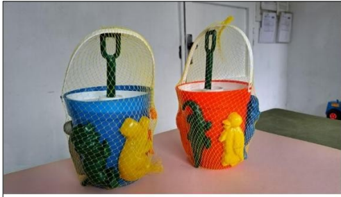
Juego de Moldes para producir tobos de playa