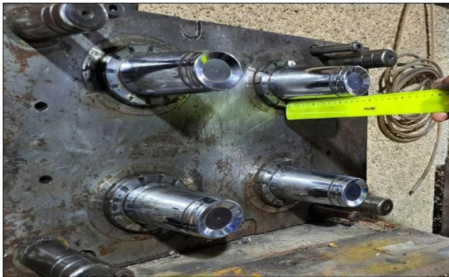
Molde vaso institucional colada caliente