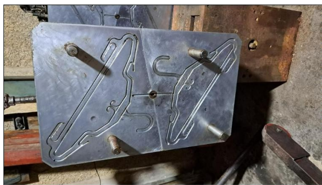
Molde gancho universal Precio $ 1350,00