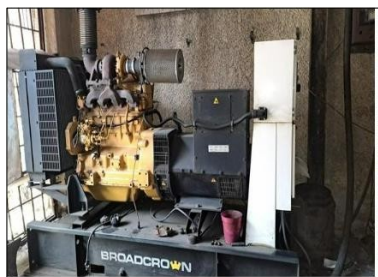
Planta Electrica marca Broadcrown motor Jhon Deere 4.5 lts y generador Stamford de 100 Kva y 3714 hrs de uso. Precio: $ 3400,00