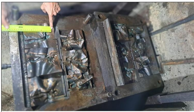
Molde soldado americano WWII aprox. 14 cm. Hay dos moldes mas, uno de alemanes y uno de japoneses.