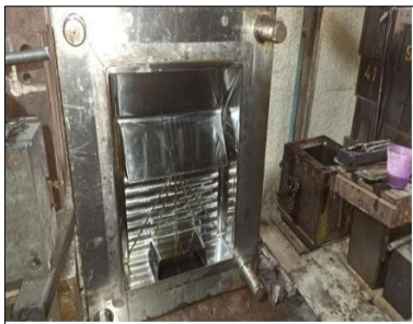
Molde de escurridor de cubiertos Precio $ 1350,00