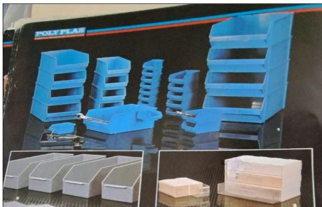
Juego de Moldes para producir Colmena plasticas. Incluye todas las piezas que estan en la foto.