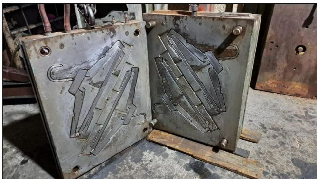
Molde gancho 420 Precio $ 1350,00