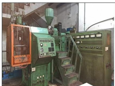
Maquina de soplado Fischer FHB 052 Capacidad de soplado 1 lt. Tambien hay una FHB3000, sopladora de Galon para reparar.