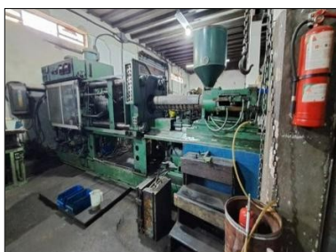
Maquina de inyeccion marca NATCO 350 Ton de cierre tornillo de 20 oz. Modelo 350E Precio $1900,00