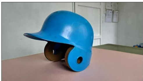
Molde para producir casco de Beisbol infantil