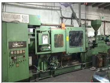
Maquina de Inyeccion Marca Vandorn de 500 ton de cierre y tornillo de 60 Oz. Precio $ 4.980,00