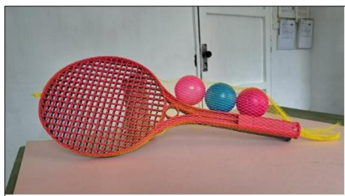
Juego de moldes para producir juego de raqueta y