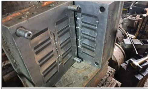
Molde para sacapiojos