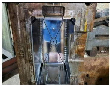
Molde frutera apilable Precio $ 1350,00